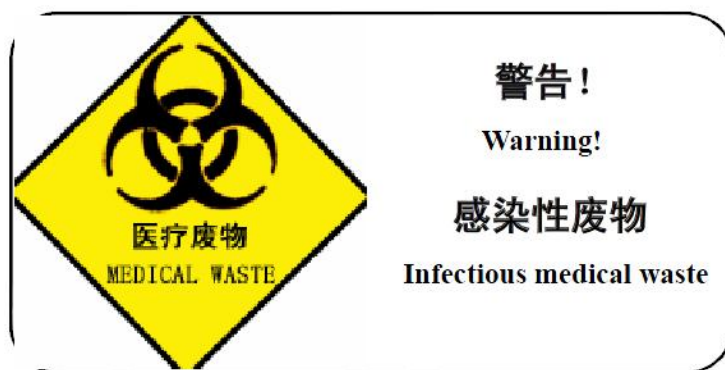
图 4-2 带警告语的警示标志

状适中，便于搬运和配合周转箱（桶）盛装。包装袋的颜色为黄色，并有盛装医疗废物类型的文字说明，如盛装感染性废物，应在包装袋上加注“感染性废物”字样。包装袋上应印刷医疗废物警示标志，带警告语的警示标志及危险废物标志见下图。