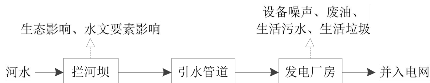
图 5-1 工艺流程及产污节点图

由上图可知，电站运行过程中主要污染物为生活污水、生活垃圾，电站厂房内设备运行噪声、设备检修时更换的废油，此外拦河筑坝会对所在河段水生生态、水文要素造成影响。